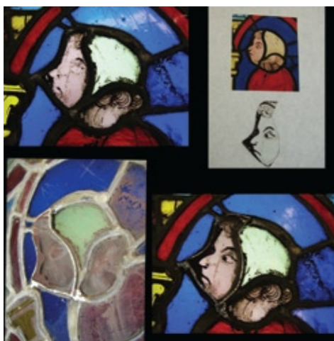
Så snart man har fjernet de oprindelige jernsprosser fra vinduespanelerne og har undersøgt forringelserne, skal glarmesteren undersøge og datere glassene. Han bevarer vinduesglas fra det 13. århundrede, selvom de er meget ødelagte eller har en forkert farve. De andre vinduer istandsættes eller udskiftes. Hvis glasvinduernes tegning er forsvundet, skal der laves en ny tegning, ikke på de originale glasvinduer, men i stedet på nye dobbeltruder. Øverst til venstre: Rudens aktuelle tilstand. Øverst til højre: Studie af personernes ansigts-træk. Nederst til venstre: Gamle glasvinduer blyindfattes igen. Nederst til højre: Resultatet.

Kirkerudernes tilstand havde allerede været genstand for vidtgående videnskabelige undersøgelser, som blev foretaget af et hold primært fra forskningsrådet CNRS. Omhyggelige forudgående tekniske studier blev udført, og resultatet for glasmaleri 101 blev testet igennem et år af et hold italienske forskere. Samme teknik blev i 2007-08 anvendt til restaurering af det midterste glasmaleri "Kristi lidelseshistorie" og vil blive genoptaget ved restaureringen af nordsidens store kirkeruder.