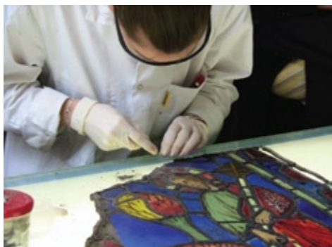
De forskellige istandsatte glasmosaikker sættes på plads igen for at genskabe det oprindelige billede og blyindfattes på restaureringsværkstederne.