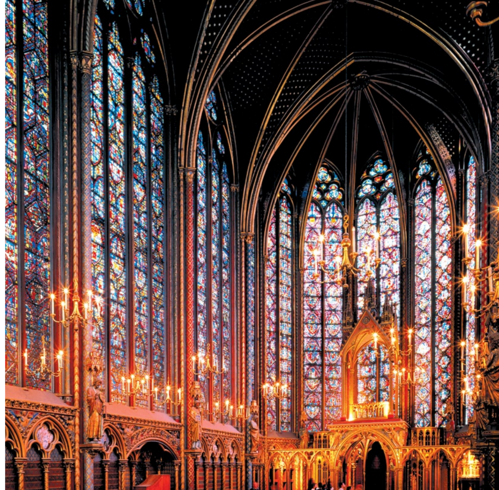
Tre ud af de fire store glasmalerier i kirkeskibet og tre i apsissen vil blive istandsat takket være støtten fra VILLUM FONDEN. Glasmalerierne kan ses til højre på dette billede.